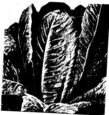
חזרת ENGLISH LETTUCE

ומצוה לחזור אחריו לצאת בו ידי חובת מרור בפסח כמבואר בש"ע או"ח סי' תע"ג סעיף ה', ובשו"ת חכם צבי סי' קי"ט, ועי' שו"ת חת"ם או"ח סי' קל"ב שכתב כי אמת נכון הדבר כי זהו המרור המובחר, והכי נהגו כל רבותי זצ"ל ואנו נוהגים אחריהם, אך רגיל אני לדרוש בשבת הגדול, מי שאין לו אנשים מיוחדים, מסוימים בעלי יראה הבודקים ומנקים אותו מרחש תולעים קטנים הנמצאים מאד מאד בימי הפסח, ואינם ניכרים לחלושי ראות, לא יקח החזרת, אף שהוא מצוה מן המובחר, ולא יכשל בלאו או בלאוין הרבה אפילו בספק משום קיום עשה דרבנן, דמרור בזמן הזה דרבנן, ויקח תמכא שקורין קריין וכו' עי"ש. ועי' דרכי תשובה סי' פ"ד סק"צד בשם כנסת הגדולה שכתב דבמקומו מצוי הרחש בחזרת, וצריך בדיקה יפה מפני שהתולעים דקים וכמראה החזרת עצמו, ומקודם היה מנהגו שלא לאכלו כי אם בבדיקה, ואחר כך משך ידו ממנו שלא לאכלו אפילו בבדיקה עי"ש, והכרתי ופלתי בסי' פ"ד ביו"ד סק"ט כתב דמיום עמדו על דעתו לא אכל סאלאט (חזרת) על סמך בדיקת נשים, וכן נכון לכל בעל תורה, כי רבה המכשלה, אמנם בערוך השלחן שם אות פ"ב כתב ומימינו לא שמענו אפילו על צדיקי ונאונים עולם שלא יסמכו על נשותיהם הכשרות בבדיקת תולעים וכן בנות ישראל העובדות בשכירות, אם הבעל הבית מכיר אותה, שהיא יראה את ד' ומדקדקת באיסורין יכול לסמוך עליה עי"ש.